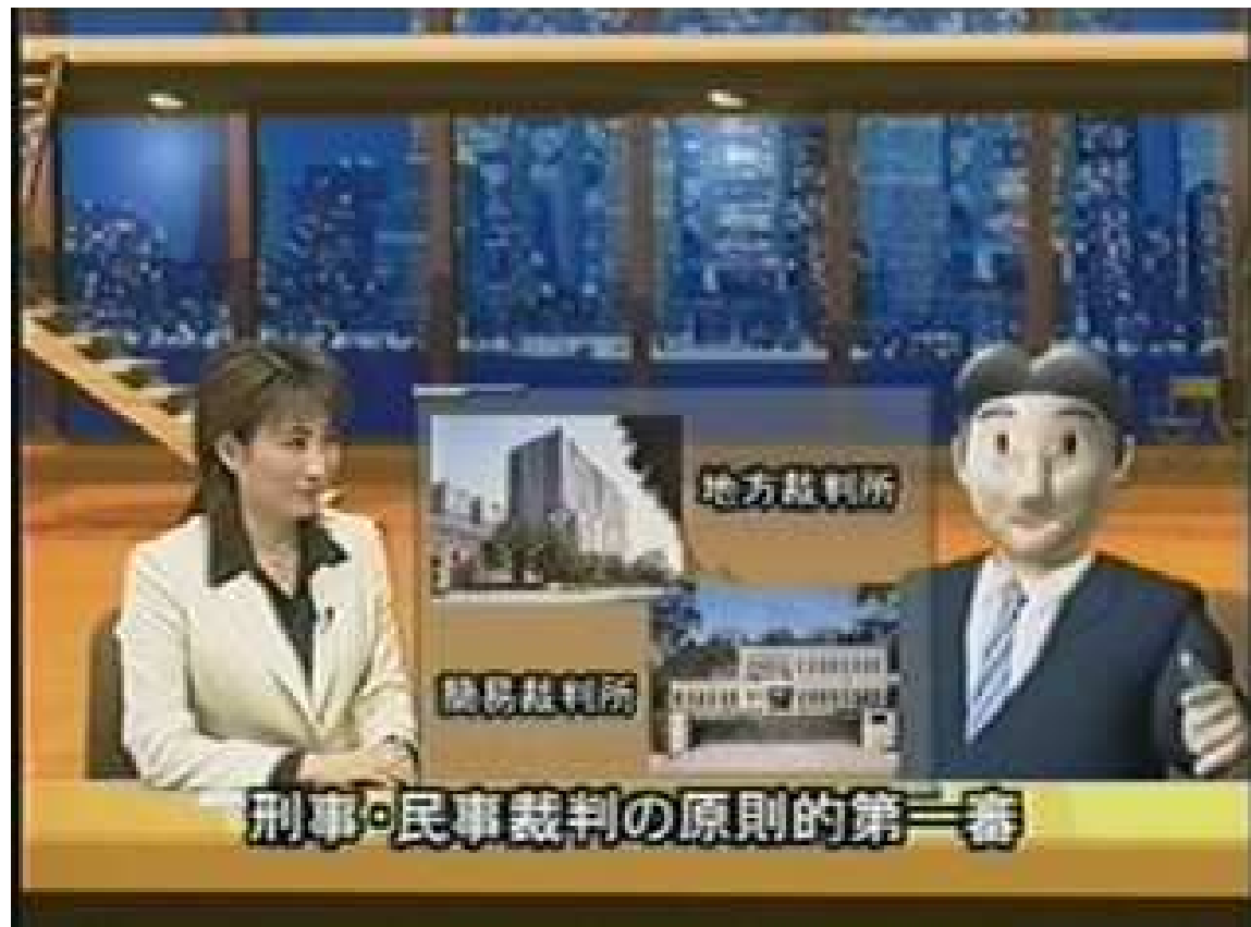
広報用ビデオ「知っていますか？裁判所」