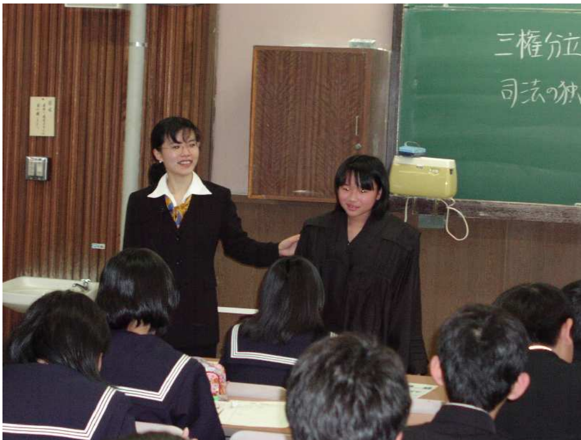
富山地方・家庭裁判所 出張講義

各地の裁判所では，裁判官が学校等へ出かけて行き，司法や裁判に関する講義を行うなどの取組みも行われている。