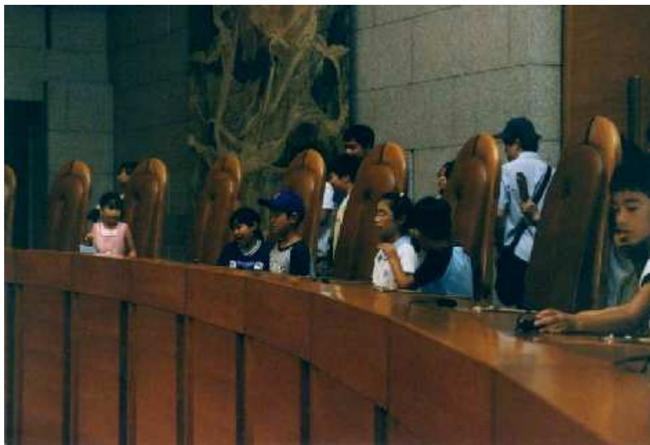
最高裁 夏休み親子見学会

最高裁判所及び各地の裁判所では，随時個人や団体の見学を受け付けているほか，模擬裁判等の企画を行っているところもある。