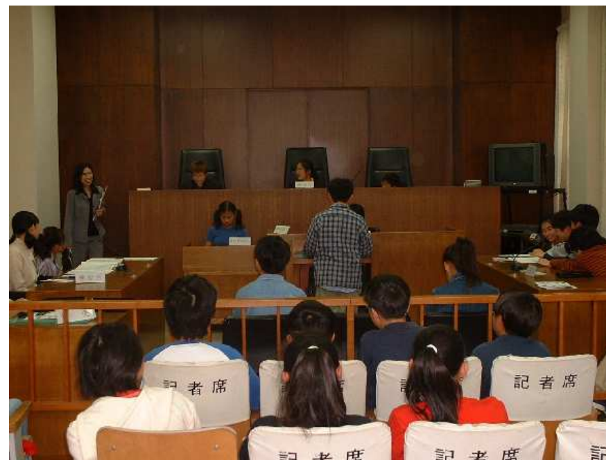
静岡地方裁判所 裁判所見学会（模擬裁判）